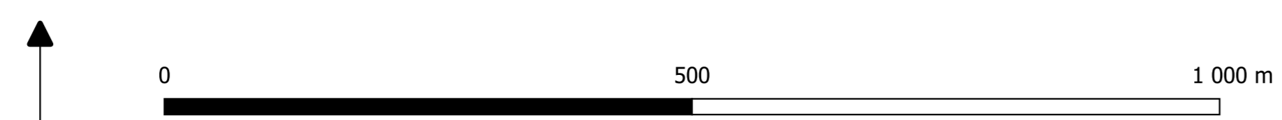
Carte de l'aléa retrait-gonflement des argiles