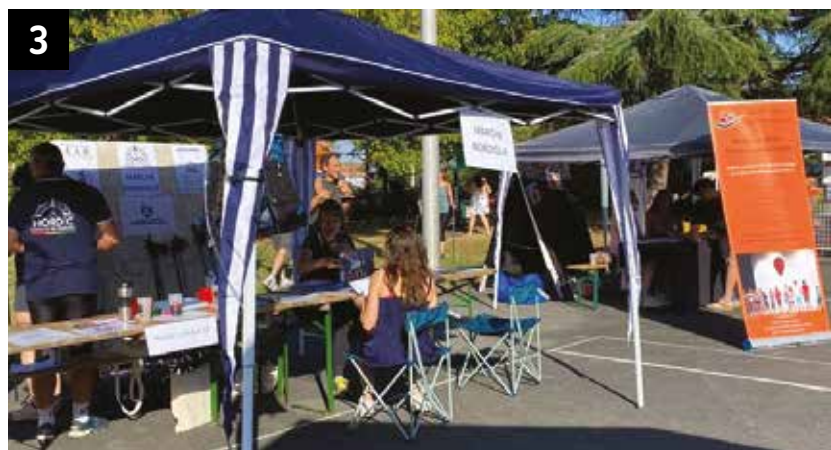
3 - Forum des associations et des entreprises, square Raoul Magna, le samedi 9 septembre.