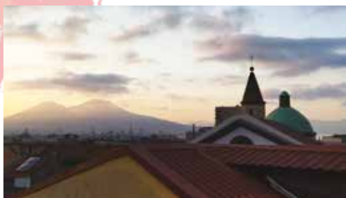
Vue sur le Vésuve depuis la ville de Naples.