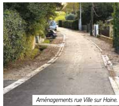
Aménagements rue Ville sur Haine.

la création de bordures pour délimiter la route et de bandes rugueuses.