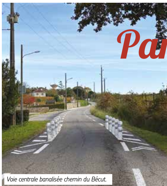
Voie centrale banalisée chemin du Bécut.