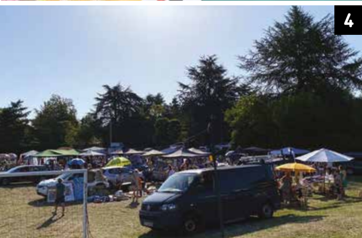
4 - Beaucoup de monde au vide-greniers organisé par le Centre Communal d'Action Sociale, le samedi 9 septembre.