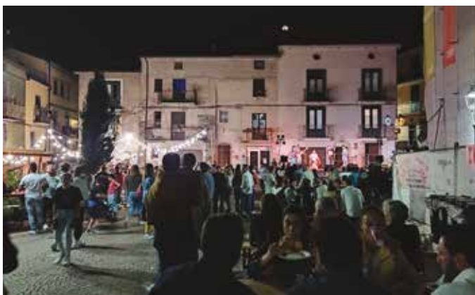
Soirée festive dans les rues de Polla.