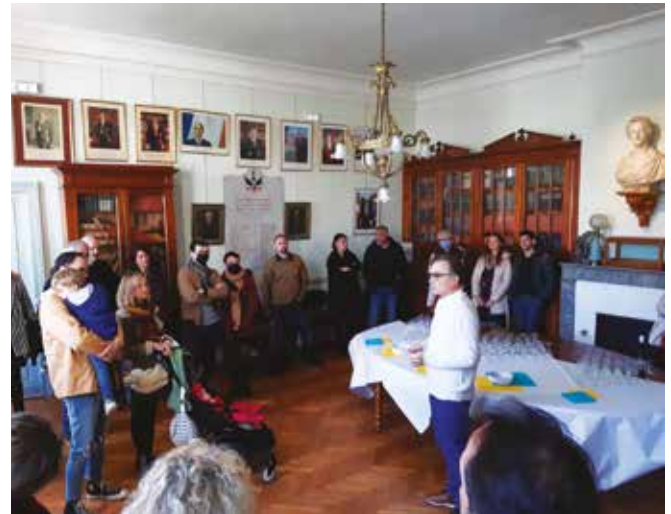
Accueil des nouveaux arrivants dans la salle du Conseil municipal.