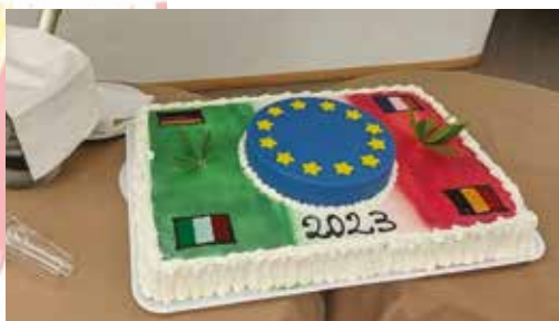
Gâteau du jumelage du dîner d'adieu de l'échange 2023 avec les drapeaux des 4 pays.

Les familles intéressées pour héberger nos amis des communes jumelées cet été sont priées de se faire connaître en mairie au 05.57.97.95.00 (séjour du 30 juillet au 8 août 2024).