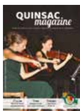
Photo de couverture : Concert du Quatuor Voce en l'église Saint-Pierre Ès-Liens.