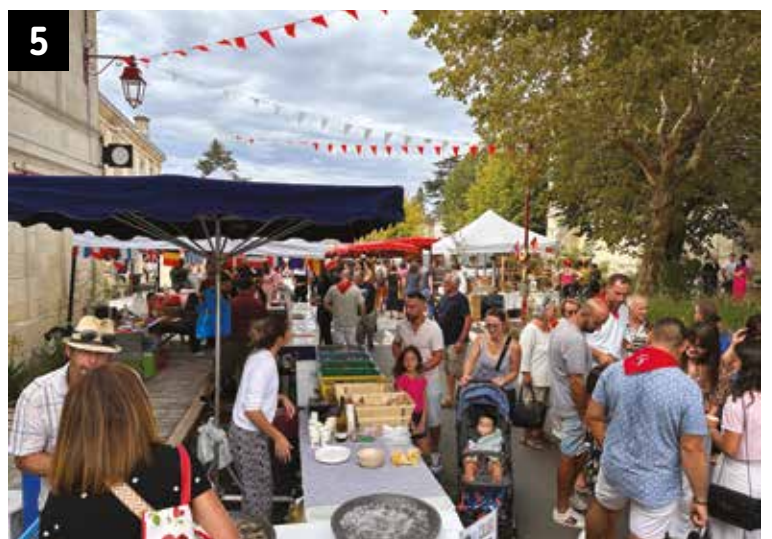
5 - Encore un grand succès pour la Fête du Clairet le samedi 17 septembre. Du monde et de la convivialité, le tout au son des bandas.