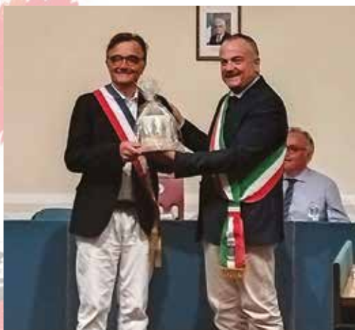
Échange de cadeaux d'amitié entre les municipalités de Polla et de Quinsac.