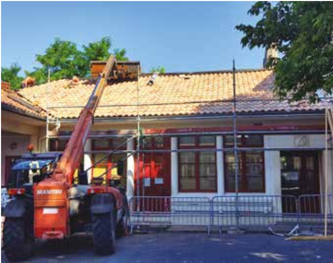
Travaux à l'école élémentaire afin d'améliorer les conditions d'accueil et d'enseignement des écoliers.