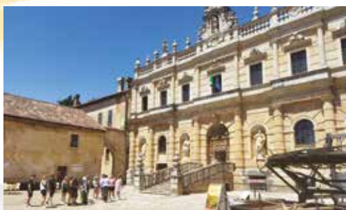
Visite de la Chartreuse de Padula, inscrite au patrimoine mondial de l'Unesco.