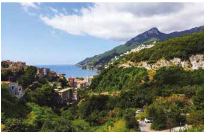
Vue sur la côte amalfitaine depuis le charmant village de Vietri sul Mare.