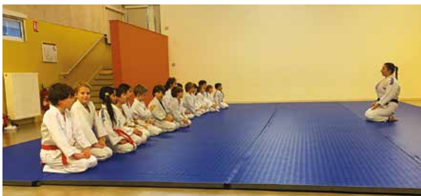
Le Judo Club Tomodachi, basé à Latresne, compte une centaine d'adhérents et propose des cours aux enfants de Quinsac depuis la rentrée de septembre.

Concrètement, comme à Latresne, les enfants sont pris en charge à la sortie de l'école et sont amenés à la salle de motricité, où des tatamis sont mis en