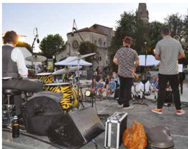
Les animations et les festivités sont nombreuses à Quinsac et dynamisent le village. Ici, la Fête du Clairet et le festival Jazz360.

Ce qui est vrai, c'est que nous avons poursuivi un modèle de développement plutôt vertueux et respectueux de l'identité de notre village ; une identité fortement marquée par la viticulture, qui malheureusement, connaît en ce moment, tout particulièrement dans l'Entre-Deux-Mers, de grandes difficultés, qui ne seront pas sans conséquences humaines, économiques et paysagères. Je ne crois pas du tout au mythe de