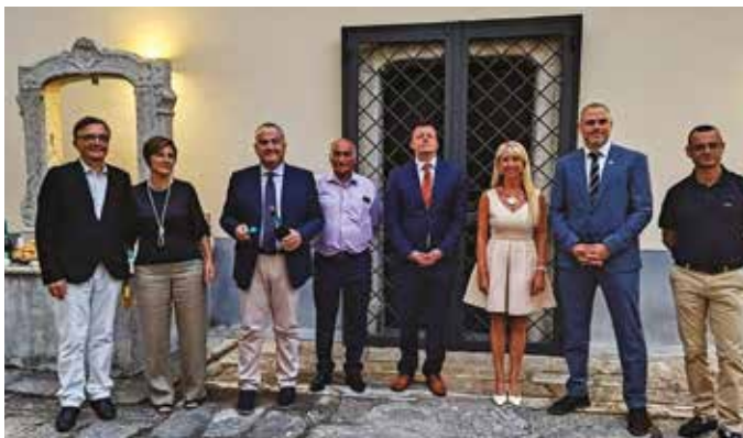
Les représentants des municipalités et des comités de jumelage des communes.