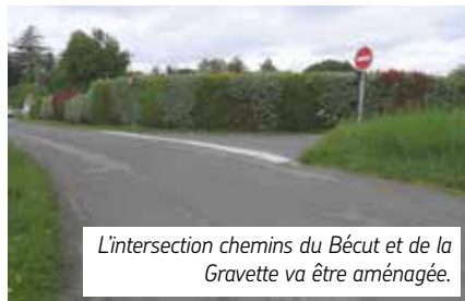
L'intersection chemins du Bécut et de la Gravette va être aménagée.

- l'entrée de l'agglomération a été déplacée juste avant le chemin de Patissey. Il s'agit d'aménager le carrefour Bécut/Gravette et ses abords afin de ralentir la circulation