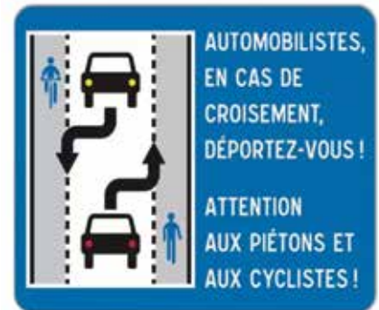
Fonctionnement d'une chaussée à voie centrale banalisée.