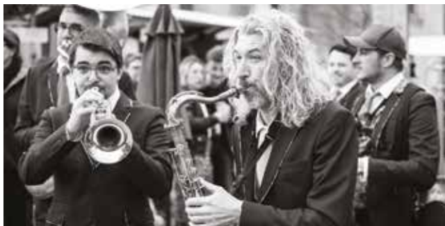
Les musiciens de Jazz Combo Box seront de passage à Quinsac le 11 juin.