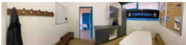
Aménagement du club-house pour les associations de karaté et de badminton.

- Brèves municipales, État civil, Agenda.