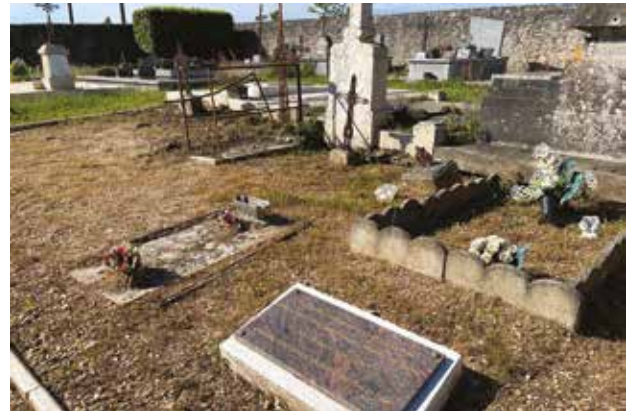
Plaque en mémoire des enfants de Quinsac décédés entre 1944 et 1948 : « Il y a quelque chose de plus fort que la mort, c'est la présence des absents dans la mémoire des vivants »

« Les familles concernées n'avaient pas ou très peu d'argent. Le maire de l'époque, devant le drame que vivaient ces jeunes parents, avait fait en sorte que les enfants soient tout de même enterrés et qu'ils aient des concessions » commente l'élue. « En regardant un peu mieux les différentes tombes, nous estimons qu'une dizaine d'enfants y sont enterrés, pour une population à l'époque de 884 habitants. C'est dire l'impact de l'épidémie au sein de la population » .